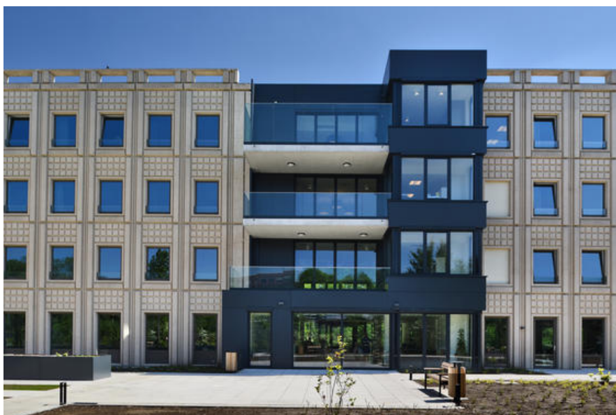
Â© ETAU ARCHITECTS

UNITED FOUNDATION - 2012 2015 - Bruxelles