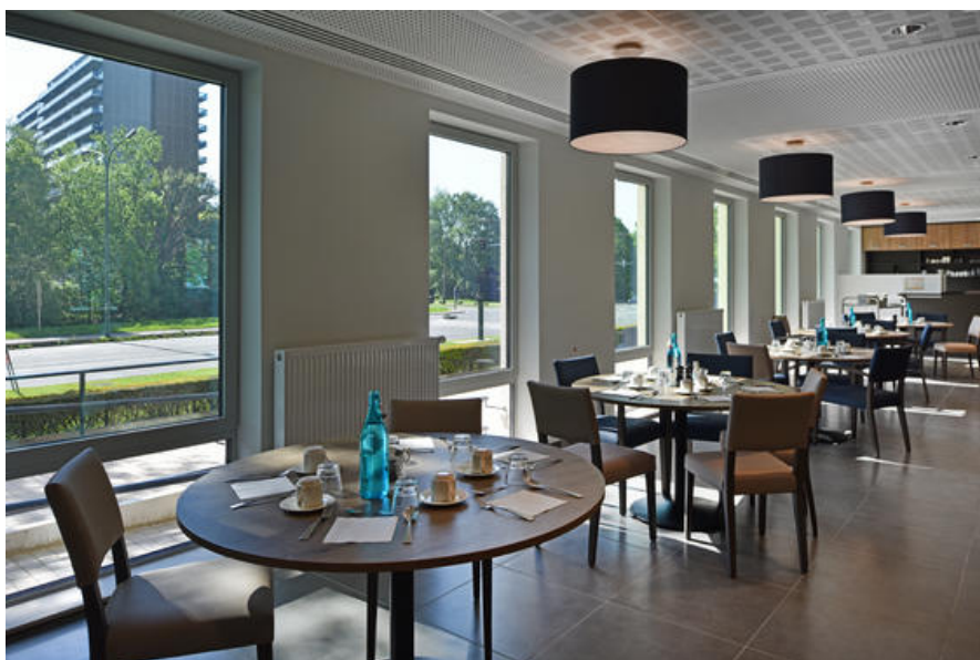
Â© ETAU ARCHITECTS