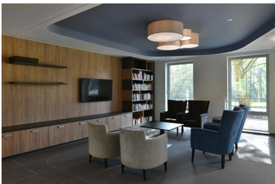
Â© ETAU ARCHITECTS