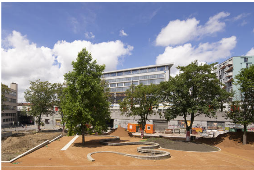
Â© GÃ NÃ RALE AssemblÃ©e dâ™ architectes