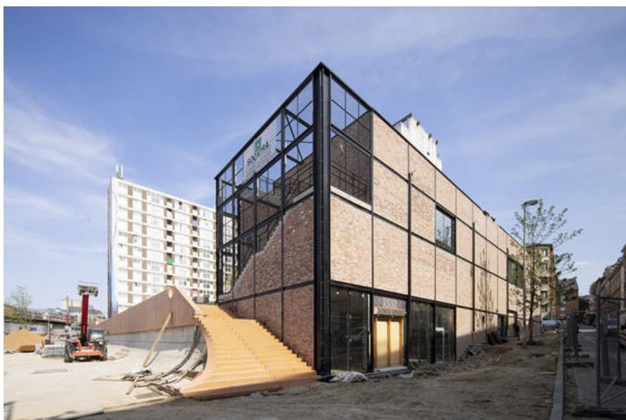
Â© GÃ NÃ RALE AssemblÃ©e dâ™ architectes