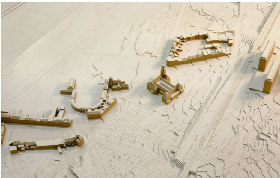
Â© Karbon! architecture et urbanisme