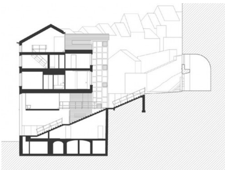
Â© aa-ar, atelier d'architecture alain richard