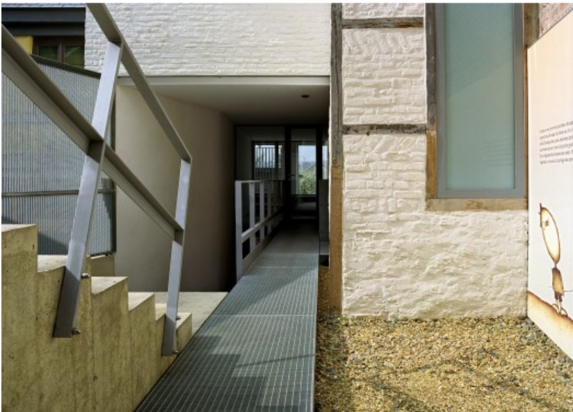
From the terrasses