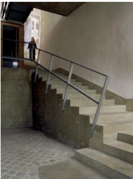
entrering the stairs