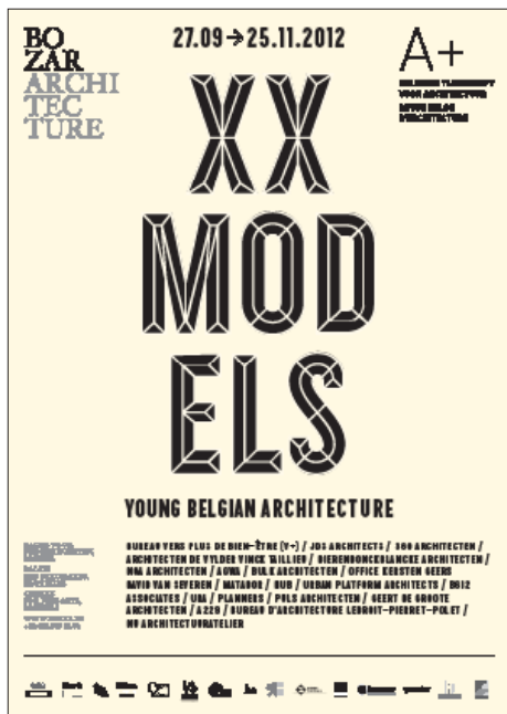
Affiche de l'exposition au Palais des Beaux-Arts de Bruxelles. Graphisme: Studio Luc Derycke

En exposant un détail à l'échelle 1/1 d'un nœud de la structure de Kortrijk Xpo, Office KGDVS traite la question de l'échelle avec plus de radicalité. C'est comme si, trop lourde pour rentrer dans les musées, l'architecture ne pouvait être montrée qu'en isolant les parties. L'objet confronte le spectateur à la réalité, fut-elle partielle, de la construction alors que, dans d'autres cas, il est invité à faire la translation inverse et à porter un regard déictique sur le projet. Qu'elles soient épurées, détaillées, colorées ou rétro éclairées, les miniaturisations, de nature plus documentaires, parfois promotionnelles, s'attachent à représenter avec réalisme la volumétrie du projet, comme sa matérialité.