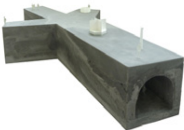
Image de campagne proposée par le bureau NU Architectuur atelier pour leur exposition NICHE, en juin 2012

IWAN STRAUVEN Coordinateur BOZAR ARCHITECTURE/A+ T +32 2 645 79 10 E iwan.straoven@bozar.be