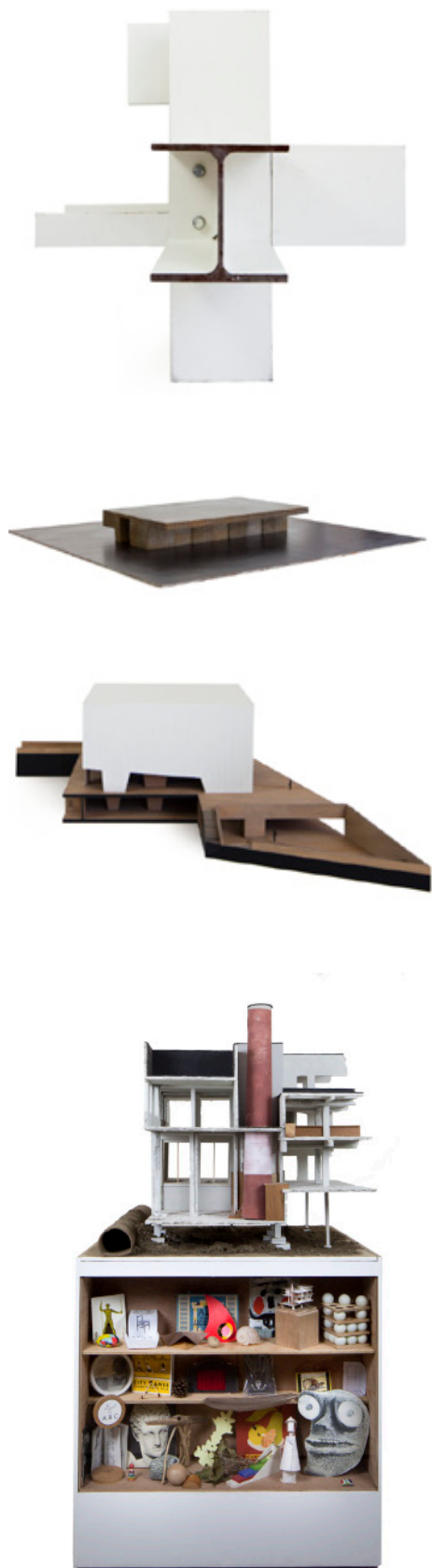
Sélection de maquettes de l'exposition: Office Kersten Geers David Van Severen, BULK, Dierendonckblancke architecten, HUB.

NU-Architectuuratelier ou noAarchitecten se saisissent de l'occasion de la commande d'une maquette pour recréer des objets autonomes, pouvant ne renvoyer qu'à eux-mêmes et qui s'affirment comme objets à part entière dans un contexte d'exposition.