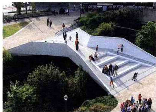
MSA, passerelle Cage aux Ours/footbridge. Schaerbeek, 2014.