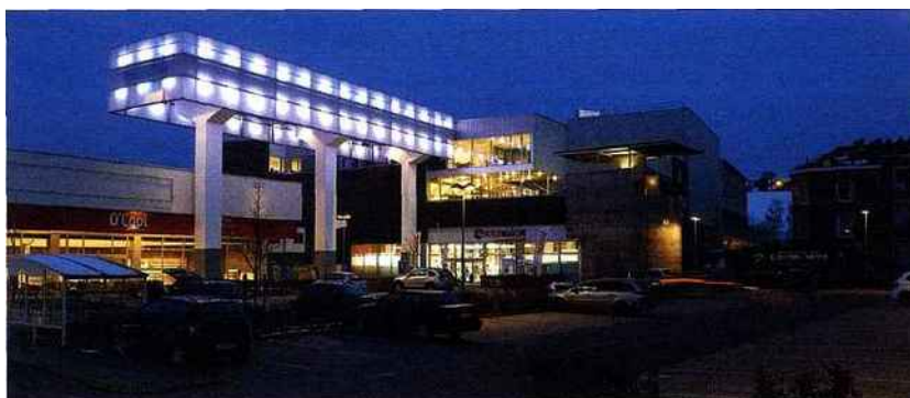
Baumans-Deffet, Interlac, Dison, 2012.