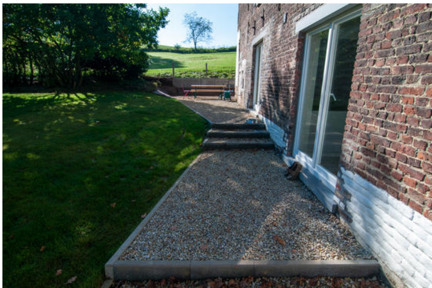
Â© MT4 Architects