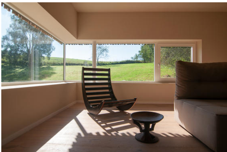
Â© MT4 Architects