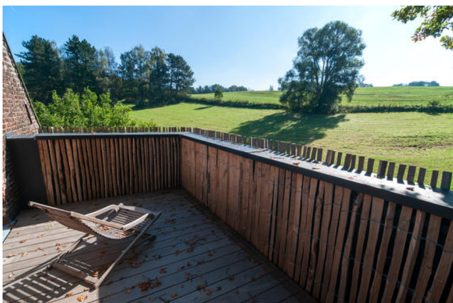
Â© MT4 Architects