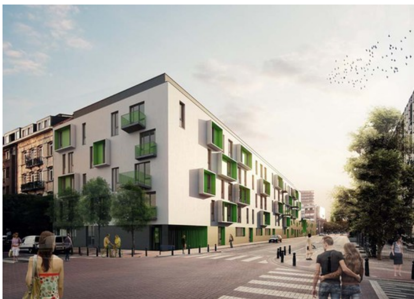
Anvers-simons arch A2M Â© A2M