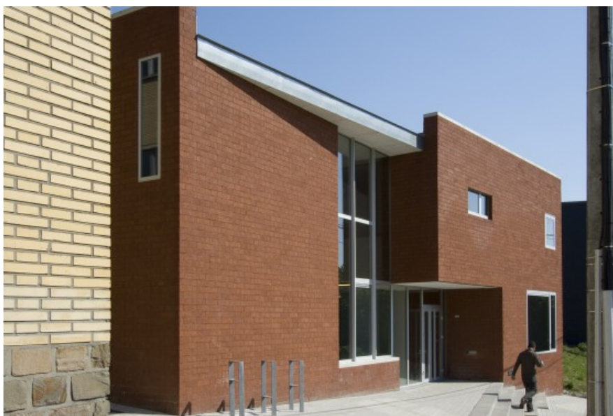
Â© Alain Janssens