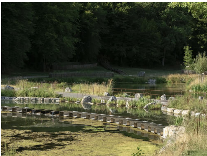
Â© Maxime Vermeulen