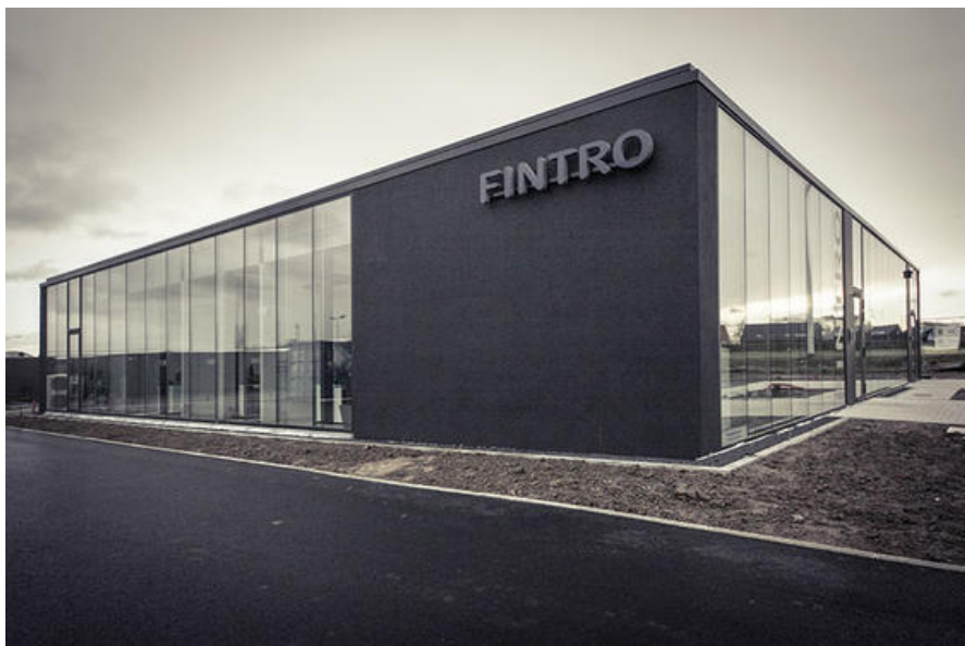
Concept : AUDE ARCHITECTES à " Blaise-Antoine Devos et Benjamin Bulot