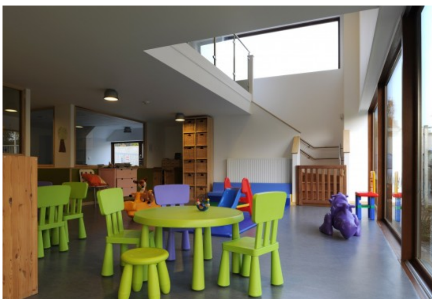
Â© AWAA for cwarchitectes