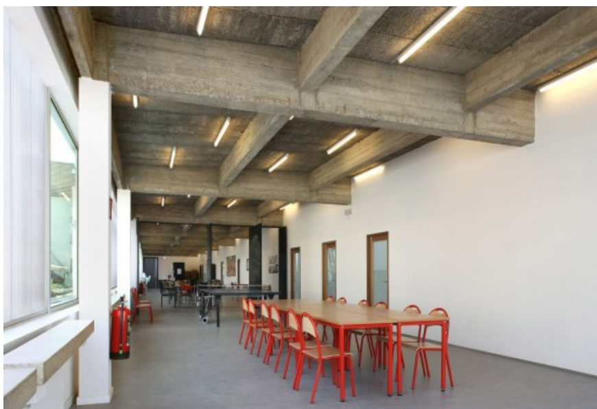
Â© Filip Dujardin