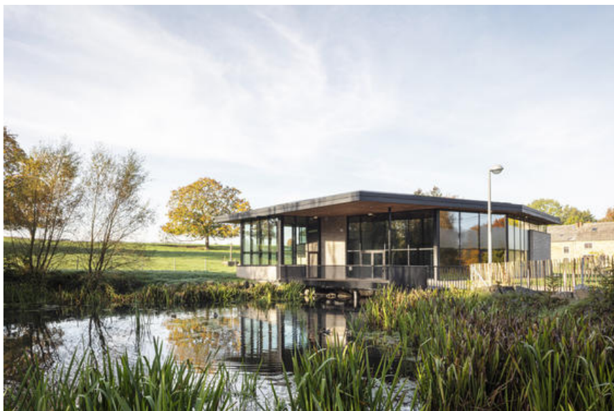
Vue depuis l'Ã©tang