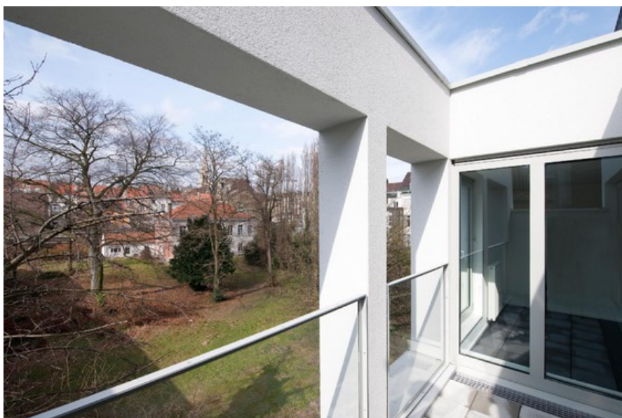
la loggia d'un logement vers le parc en intérieur d'@lot