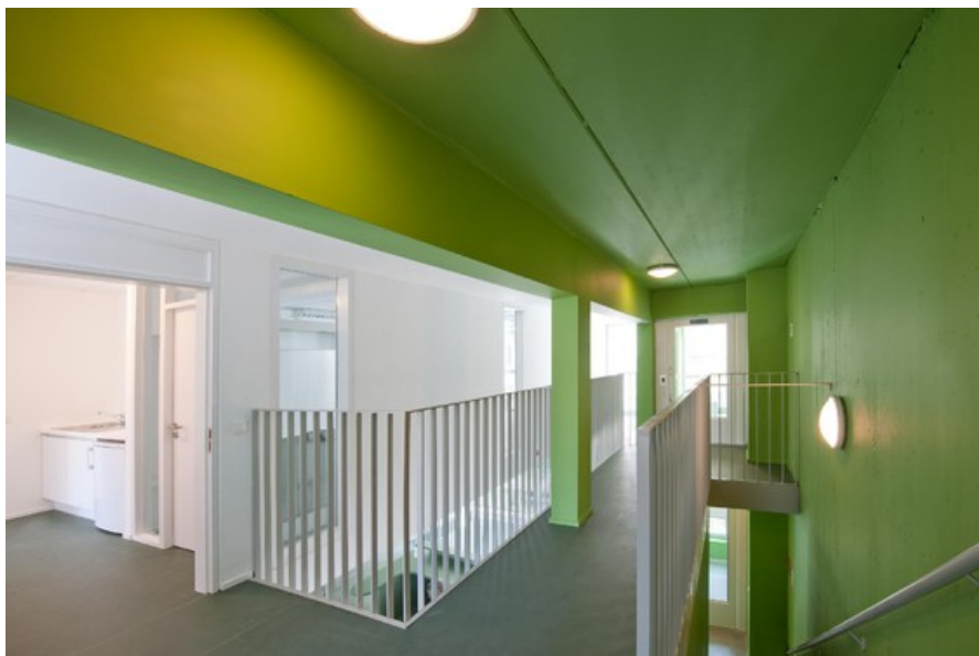
la faille de lumière