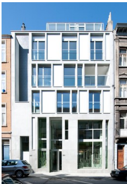
le tissage en béton de la façade © Marc Detiffe