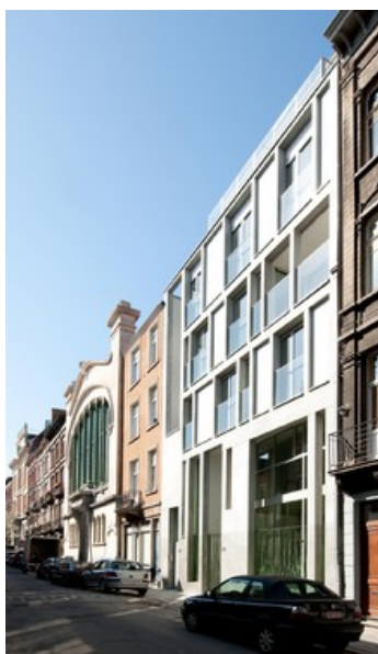
le dialogue des bâtiments publics