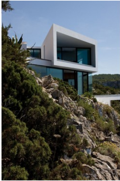
Â© Jean Luc LALOUX