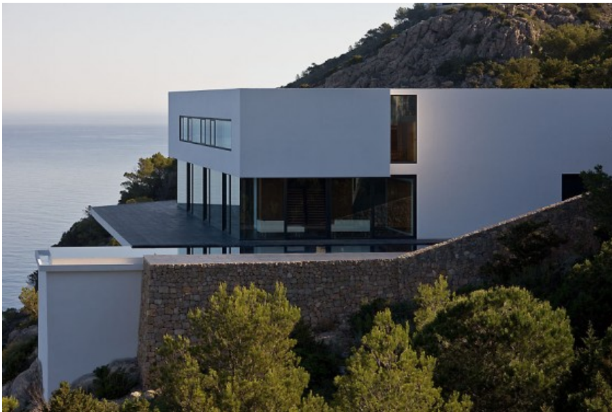
Â© Jean Luc LALOUX