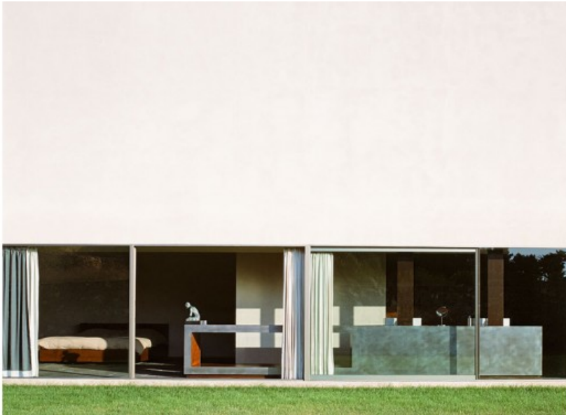
Â© Jean Luc LALOUX