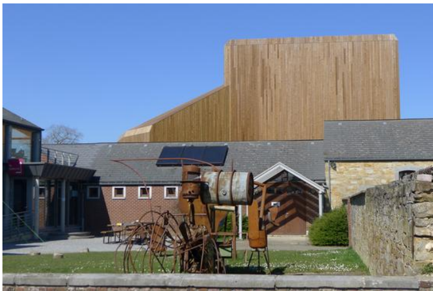
Vue de la Place Â© Atelier MW