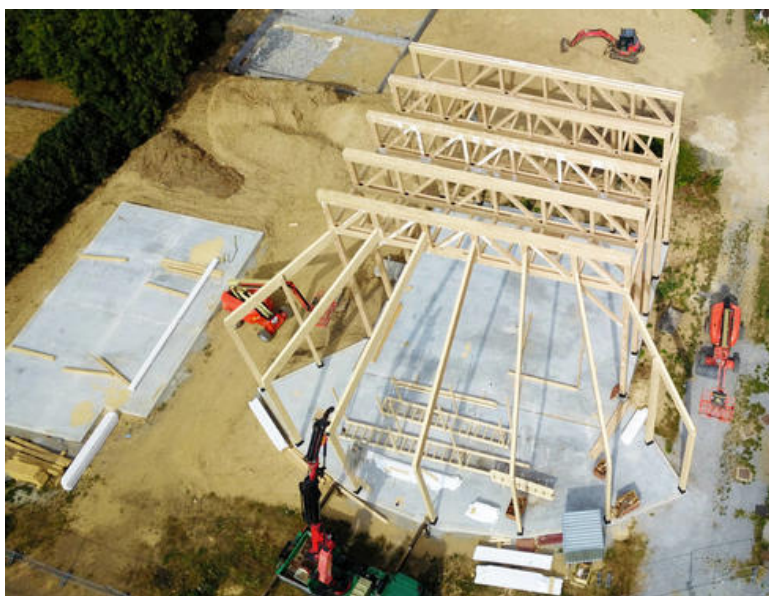
Vue aérienne ossature bois