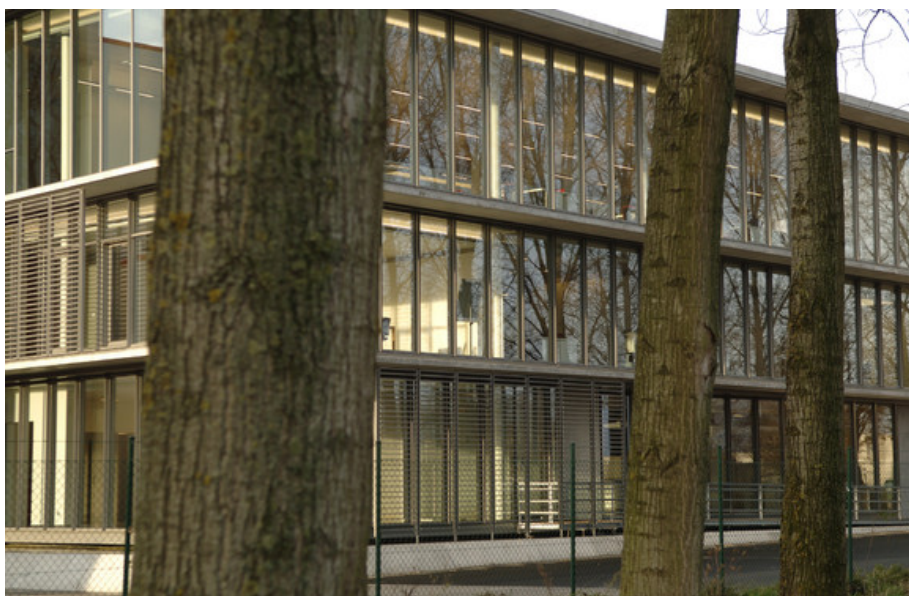
Â© Atelier d'Architecture Galand