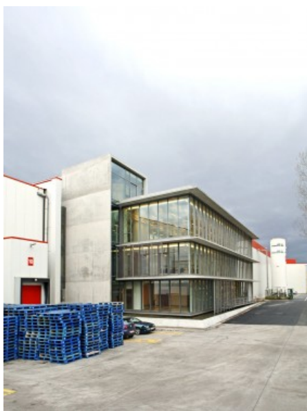
Â© Atelier d'Architecture Galand