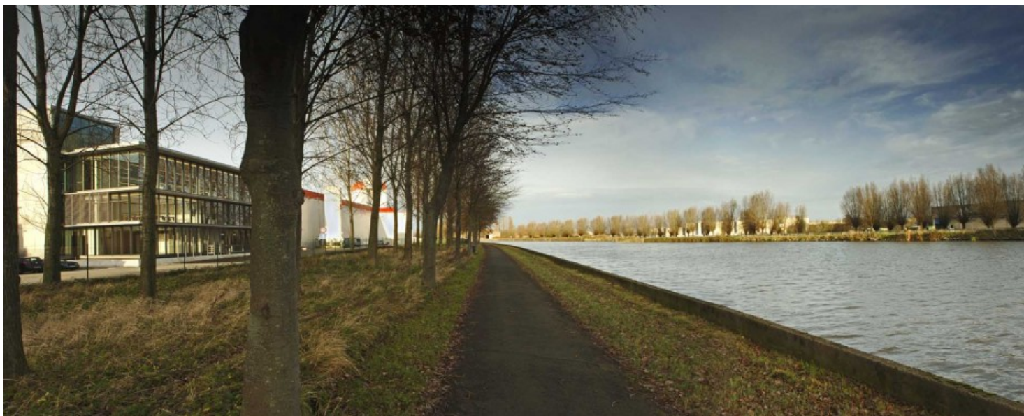
Â© Atelier d'Architecture Galand