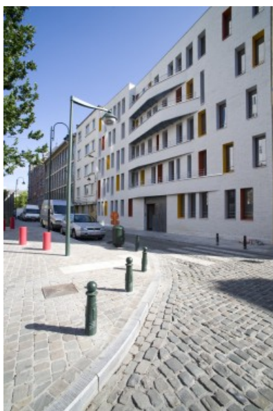
Â© B612 associates