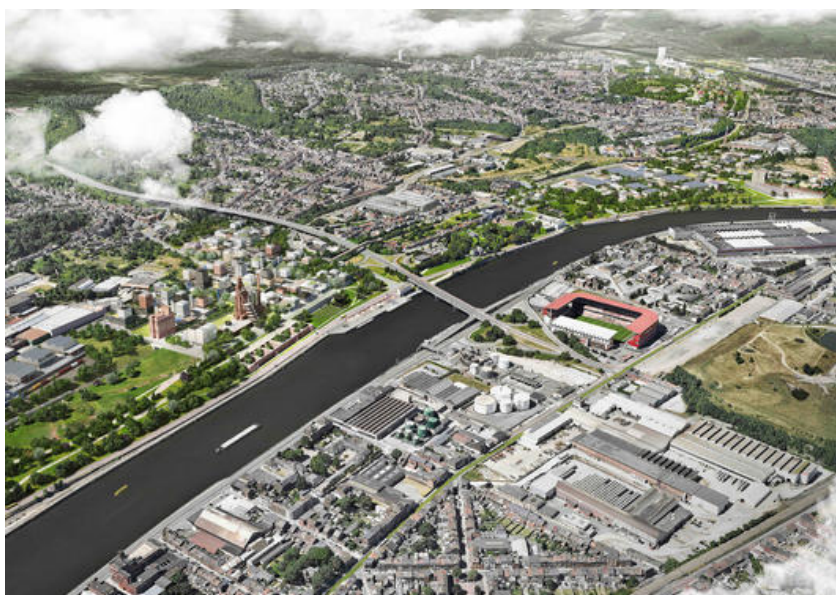
Vue aérienne de la chaîne de parcs

Â© Baumans-Deffet, Architecture et Urbanisme