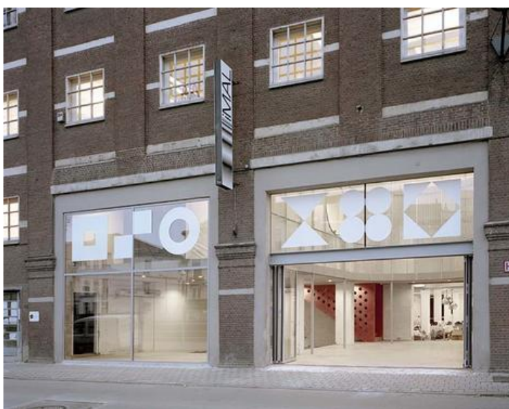
Â© CENTRAL office for architecture and urbanism