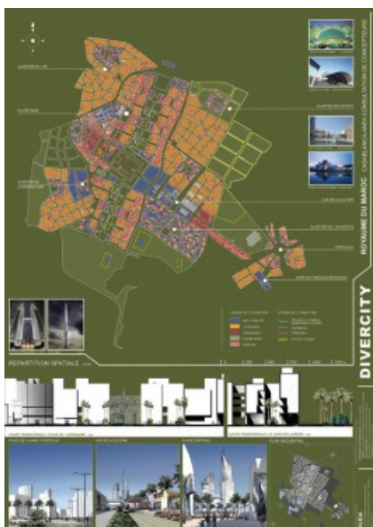
Concours International - Panneau 2 Â© CERAU Architects Partners