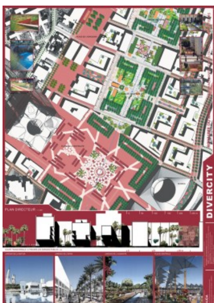
Concours International - Panneau 3 Â© CERAU Architects Partners