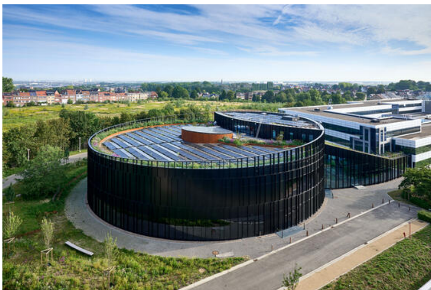
Â© Philippe Piraux