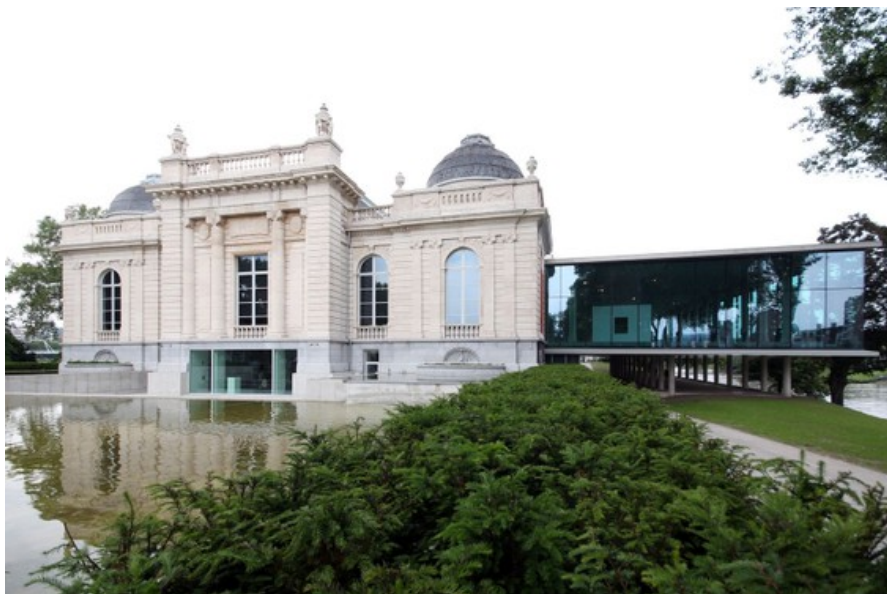
Â© Mathieu Joiret