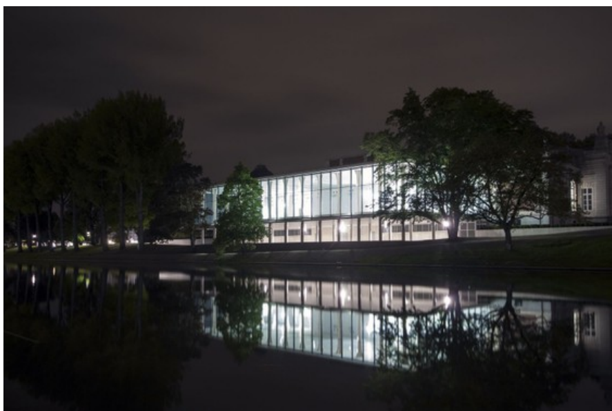
Â© Mathieu Joiret