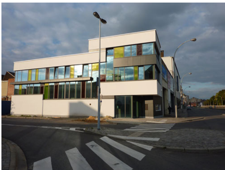
Let it be © Creative Architecture sprl