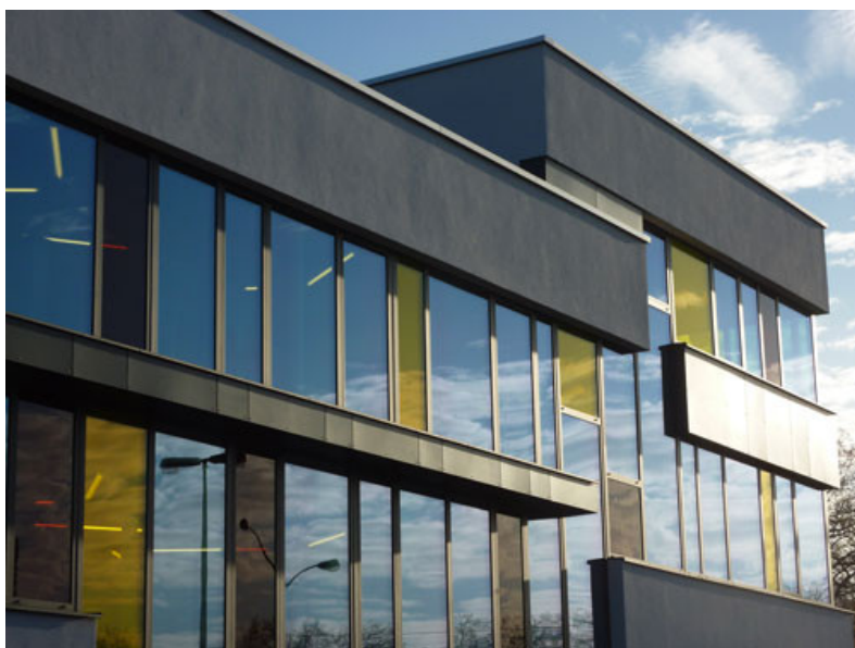
Contre jour.