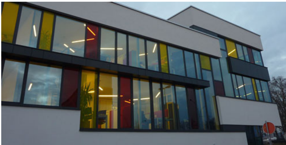
Couleur d'automne