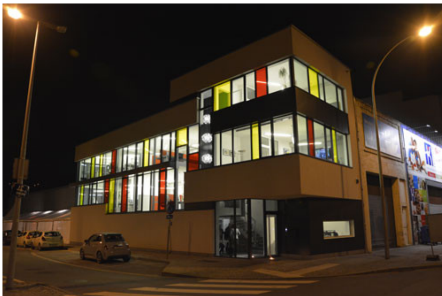
Vision nocturne du quai © Creative Architecture sprl