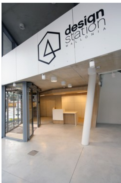
Accueil Â© CrÃ©ative Architecture sprl