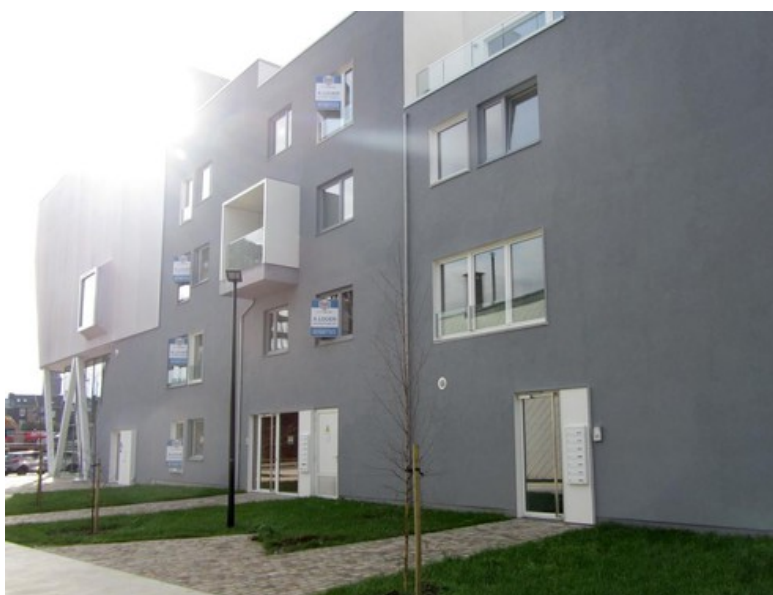
Logements en promotion Â© CrÃ©ative Architecture sprl