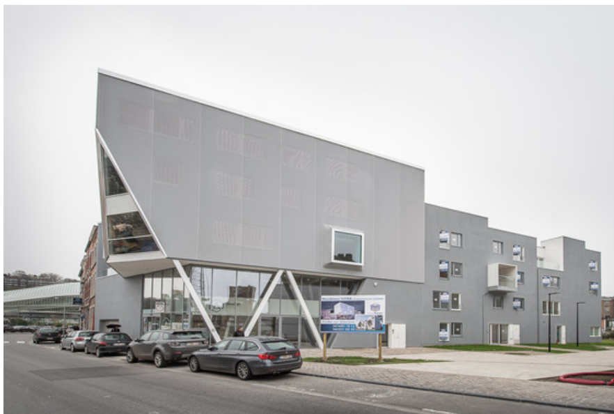
Vue de la rue Paradis Â© CrÃ©ative Architecture sprl