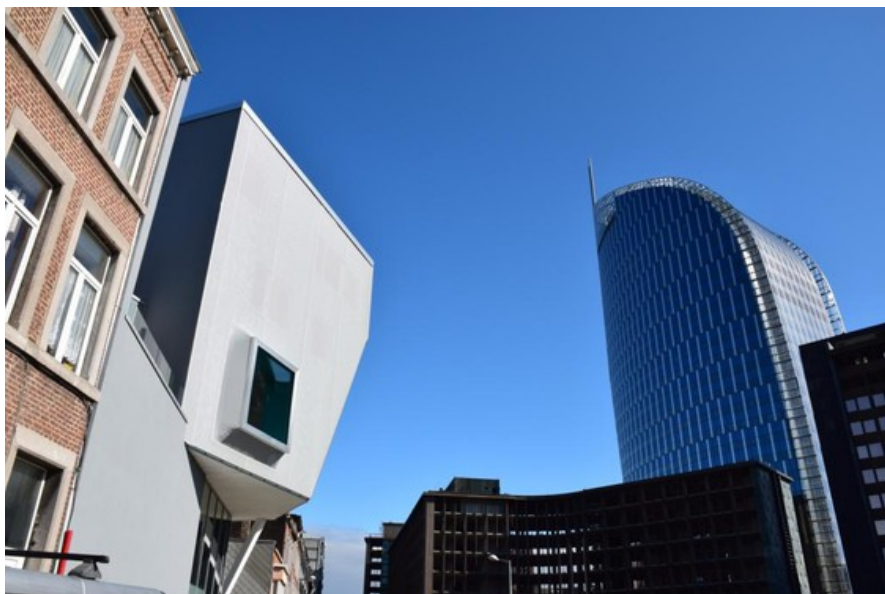
Cohabitation harmonieuse Â© CrÃ©ative Architecture sprl