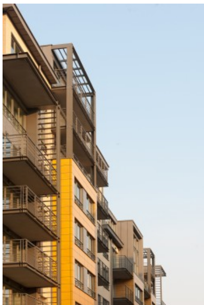
Â© Marc Detiffe for DDS & Partners Architects