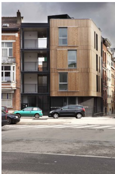
librex 02 Â© Lode Saidan