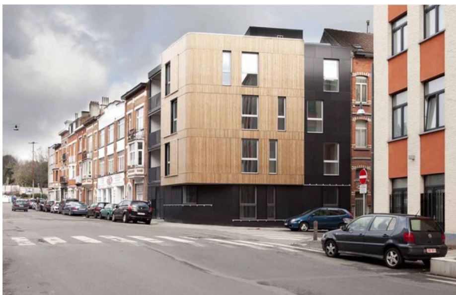
librex 01