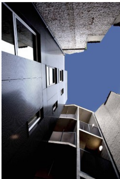
librex 05