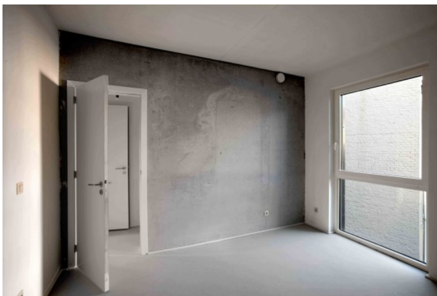
librex 04