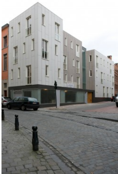
Â© Â Lode Saidane