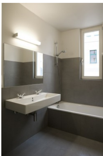
Â© DÃ©lices Architectes scprl