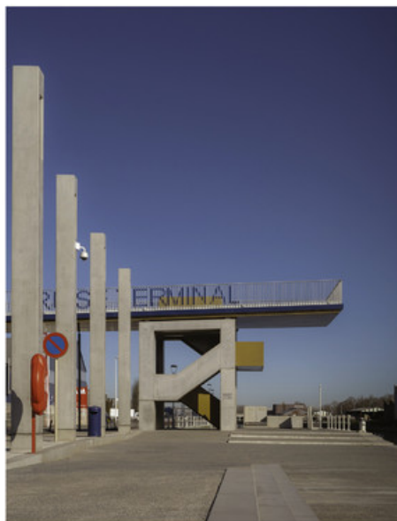
Le bÃ©ton brut pour s'inscrire dans le contexte industriel