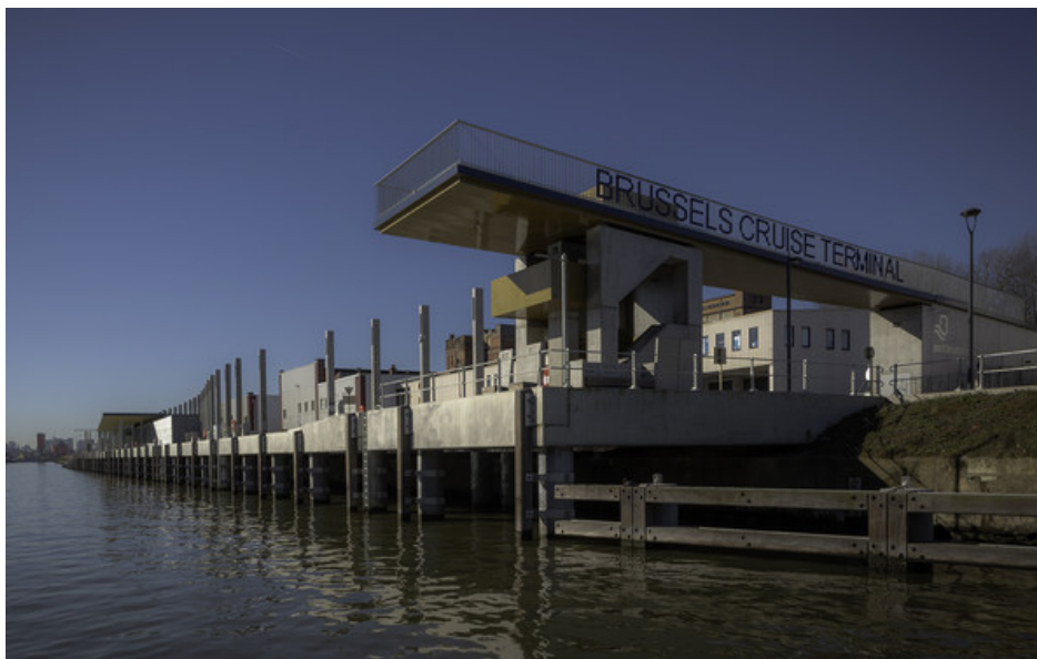
La passerelle, point de vue inÃ©dit sur le canal