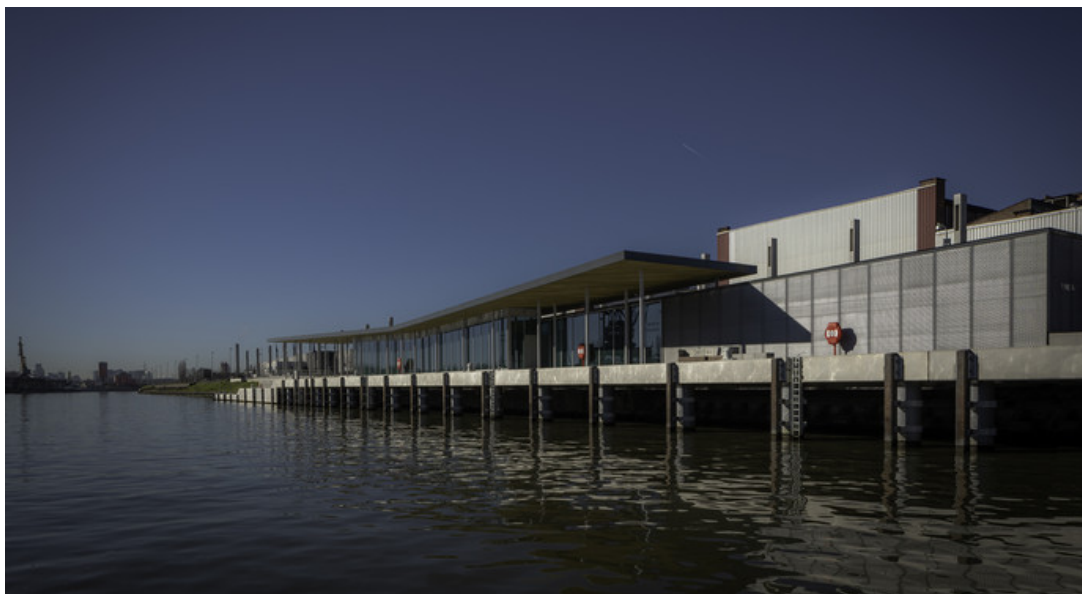
Le quai, l'avent et le restaurant

Spéciales éclairage Biospaces - Véronique Claeys