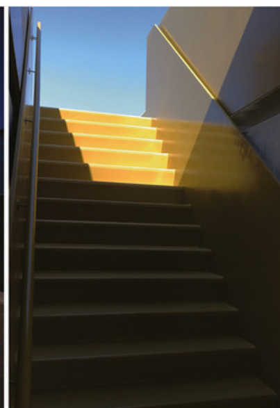
L'acier poli dorÃ© pour jouer avec les reflets de l'eau et de la lumiÃ¨re.