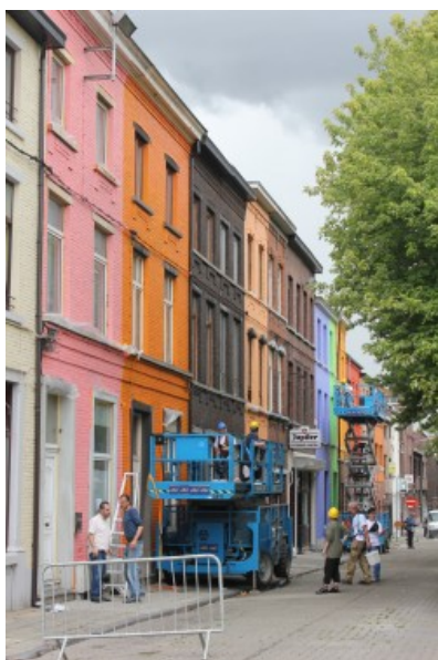
Le chantier