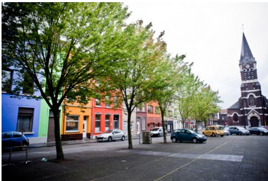
La place du Nord