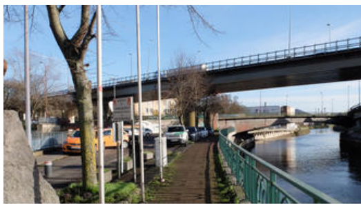
Charleroi - Quai Arthur Rimbaud