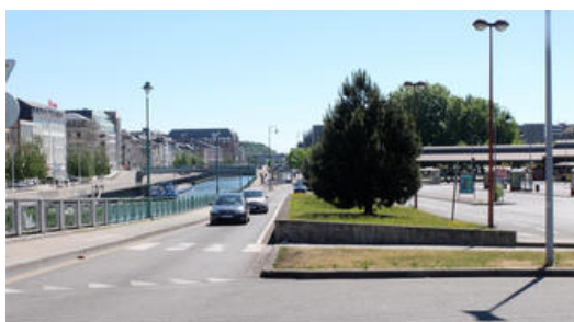
Charleroi - Quai de la gare du Sud