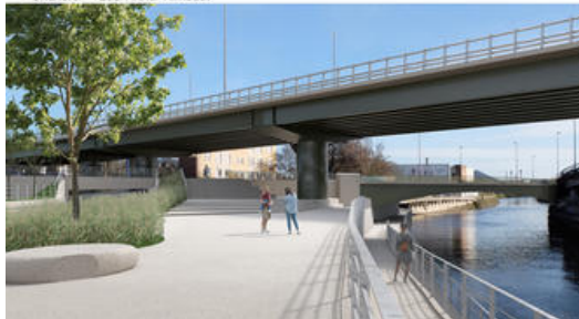
Le Quai Arthur Rimbaud avant- après.