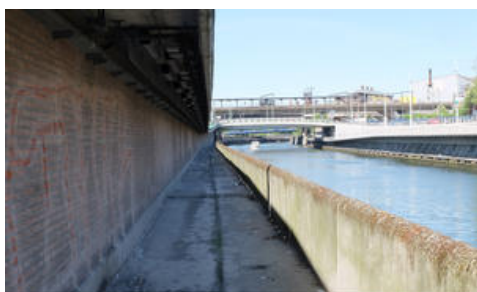
Charleroi - Chemin de halage