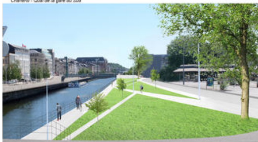
Le Quai de la gare du Sud (image de concours)