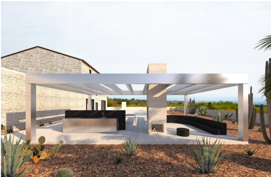
Â© Estate Estate