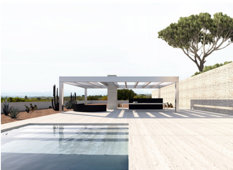
Â© Estate Estate