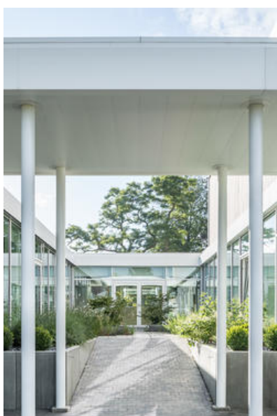
Â© Maxime Vermeulen