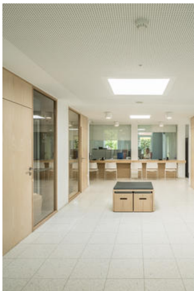
Â© Maxime Vermeulen