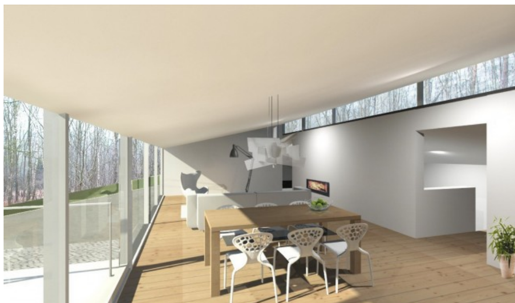
Vue intérieure © GOFFART POLOME ARCHITECTES