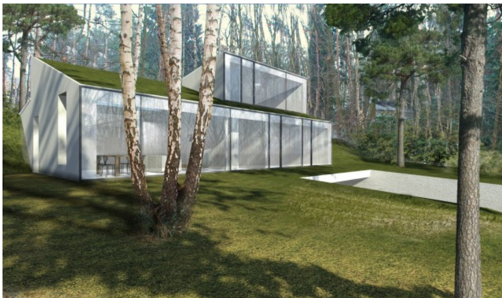
Vue Nord-Ouest Â© GOFFART POLOMĂ ARCHITECTES