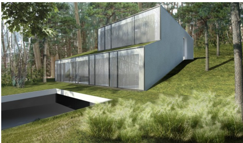
Vue Sud-Ouest Â© GOFFART POLOMĂ ARCHITECTES