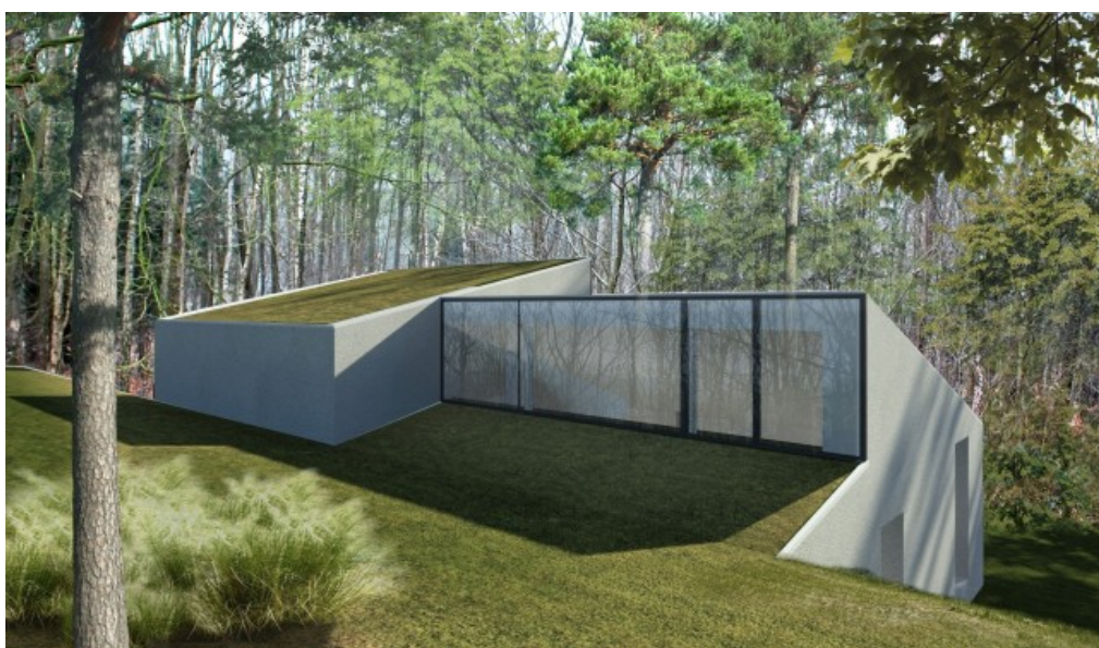
Vue Nord-Est Â© GOFFART POLOMĂ ARCHITECTES