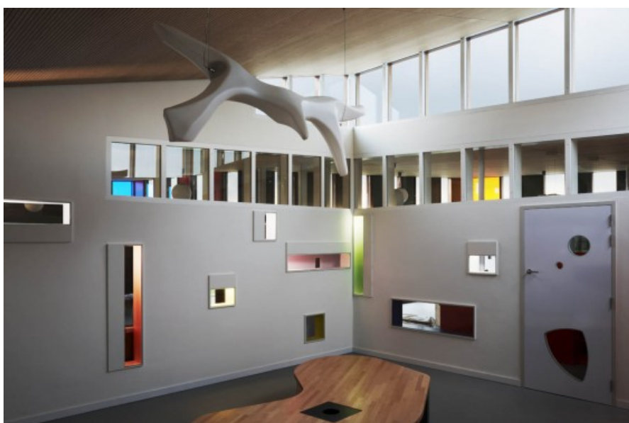
Â© Alain Janssens