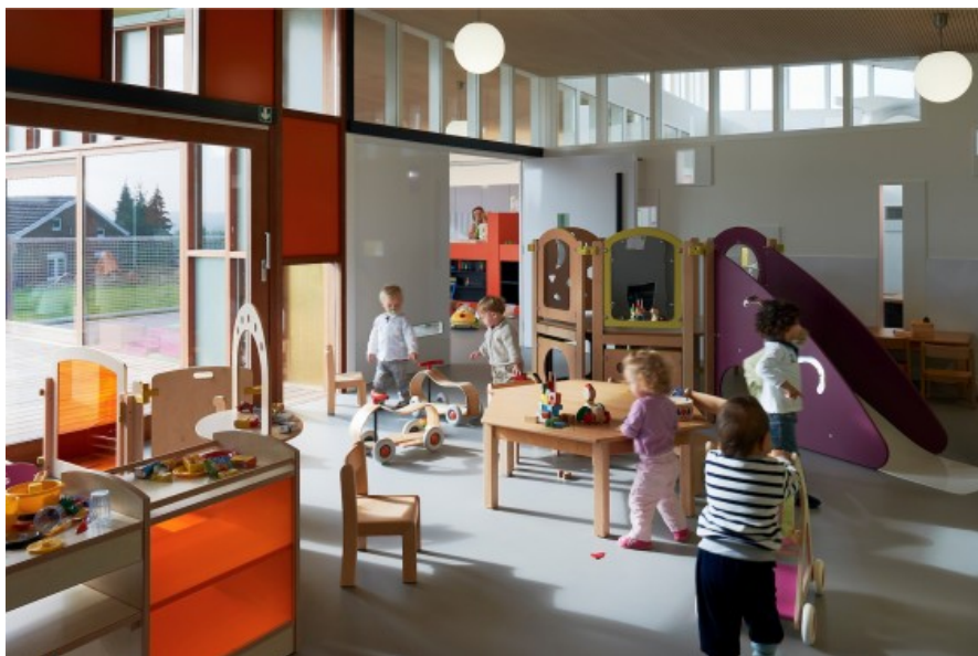
Â© Alain Janssens

Georges-Éric Lantair (design et mobilier)