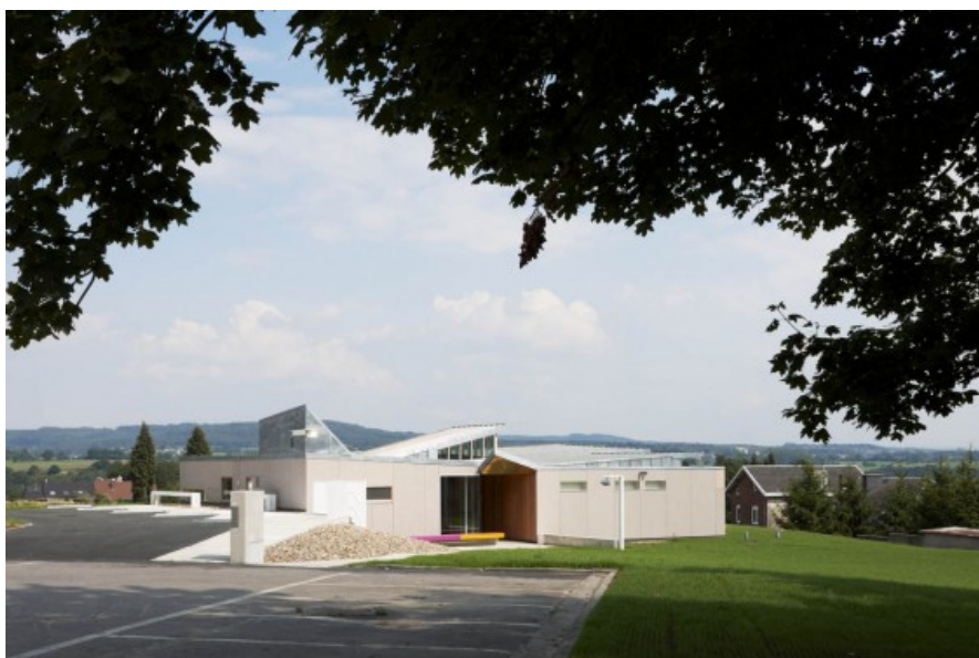
Â© Alain Janssens