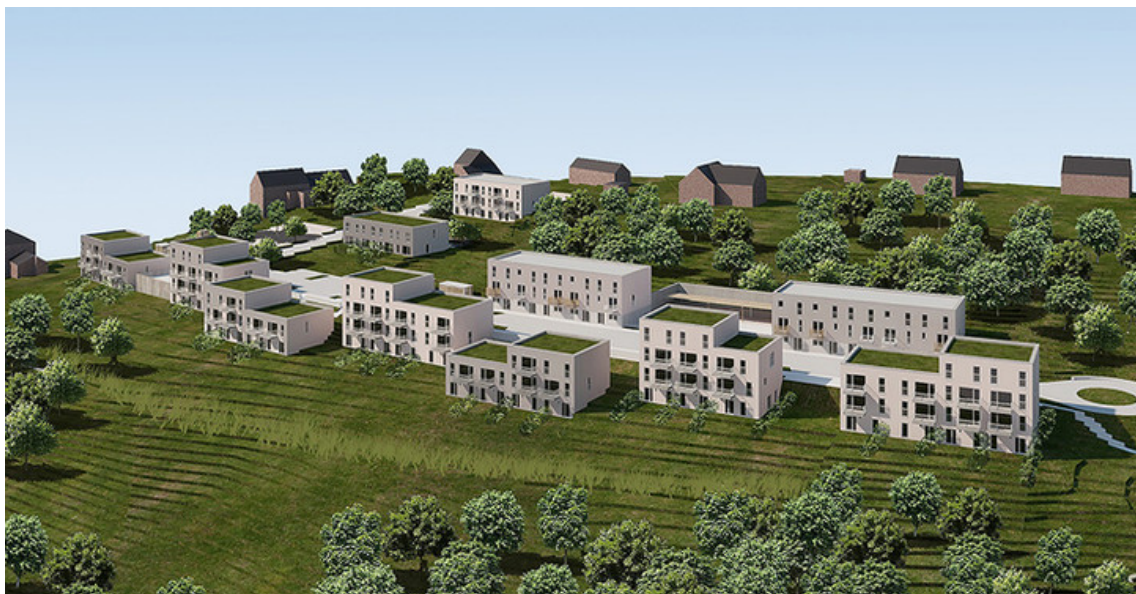
THIER D'ERBONNE 01 Gerard-Lemaire&Associés