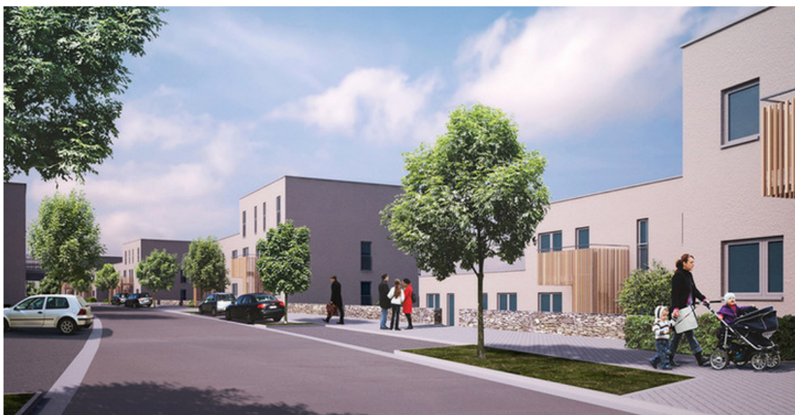
THIER D'ERBONNE 03 Gerard-Lemaire&Associés © Gérard-Lemaire & Associés