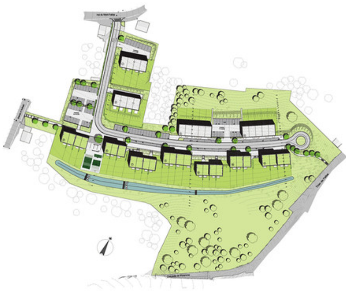
THIER D'ERBONNE 02 Gerard-Lemaire&Associés