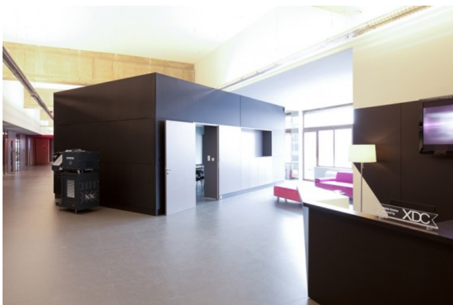
Â© Atelier d'Architecture AIUD