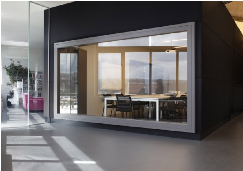
Â© Atelier d'Architecture AIUD