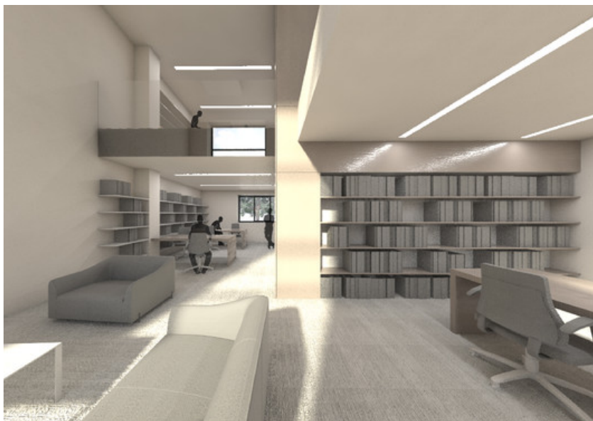
Â© H2A Ir Architecte & AssociÃ©s