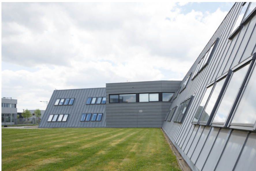
Â© Marcel Van Coile