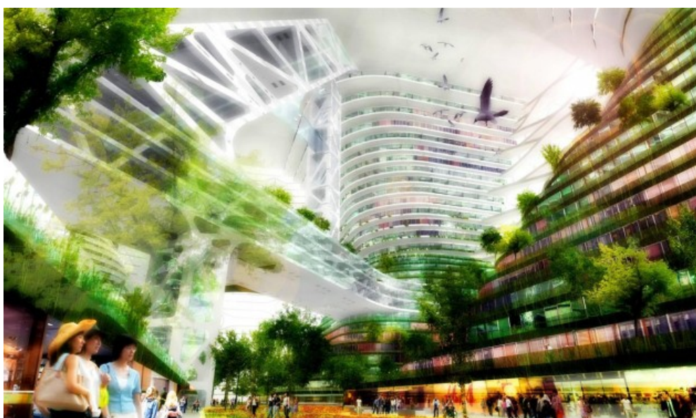
© JDS Architects Julien De Smedt