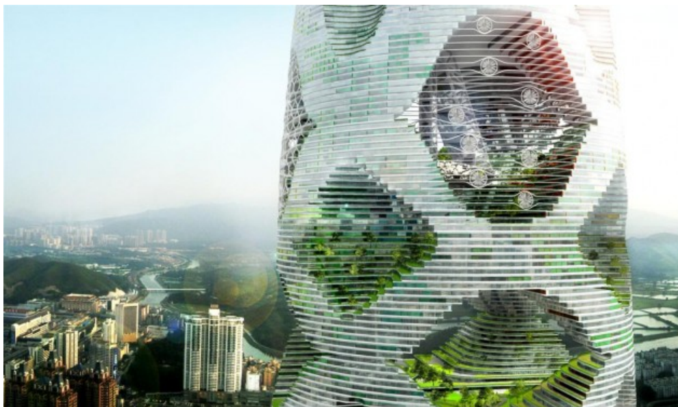
© JDS Architects Julien De Smedt