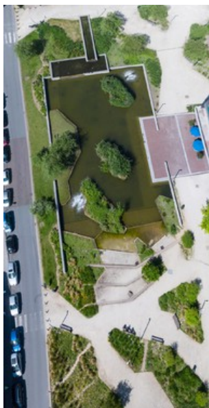
Â© JNC International s.a. "Joining Nature and Cities"