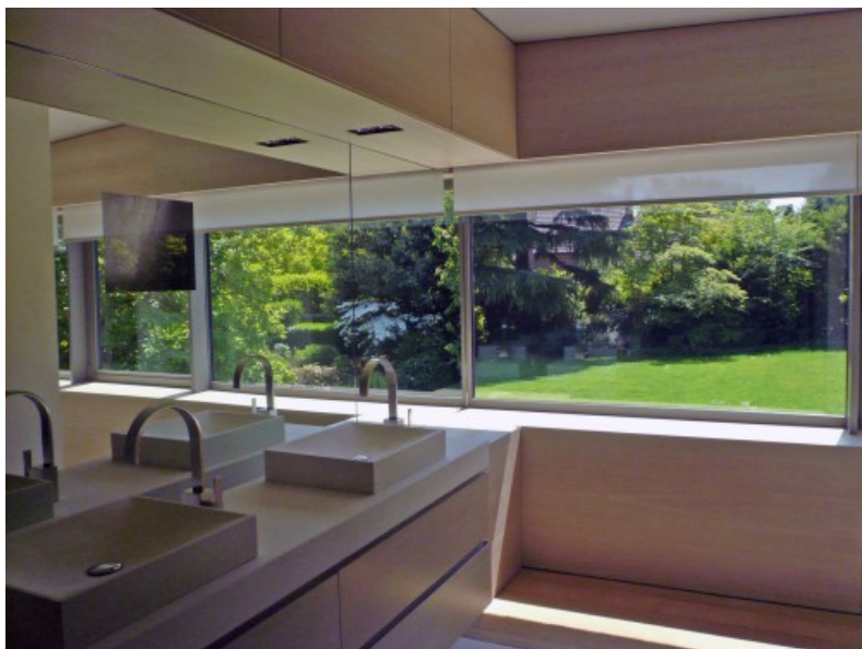
Vue intérieure de la salle de bain principale. © Joël Claisse Architectures