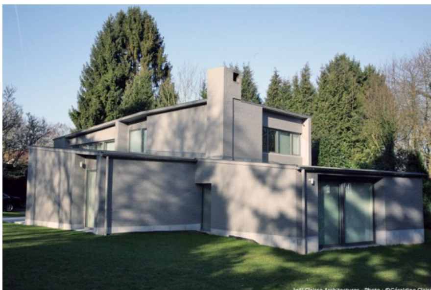
Vue de la nouvelle extension.