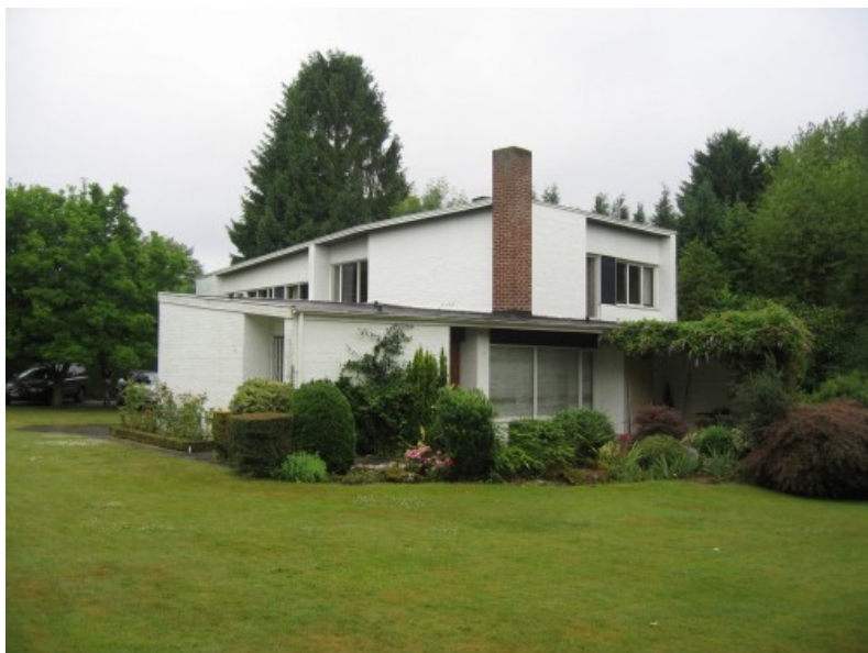
Vue de la situation d'origine. Â© Joël Claisse Architectures