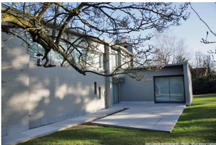
Vue de la terrasse. Â© G raldine Claisse