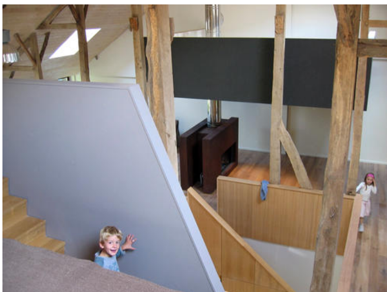
Â© Johanne Hubin