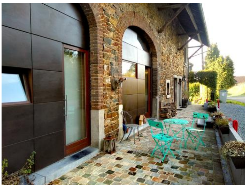
Â© Johanne Hubin