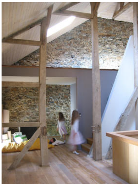
Â© Johanne Hubin