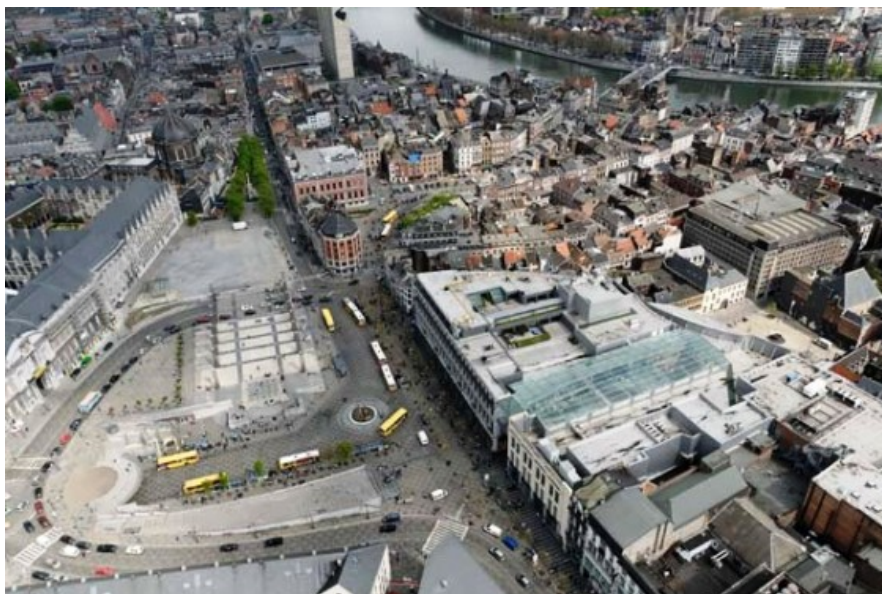
Â© L'ATELIER soci  t   d'architectes SA