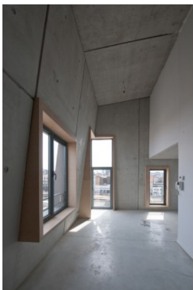
Â© Marc Detiffe