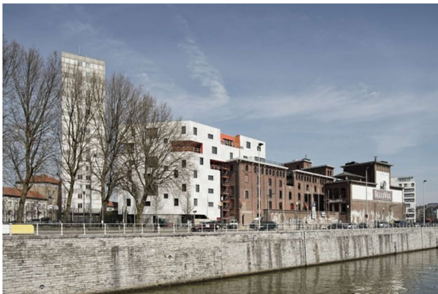
Â© François Lichtle