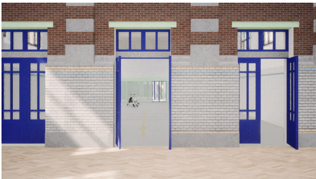
R  ouverture des trois portes de la salle de gymnastique vers l'ancien grand bassin Â© Ledroit Pierret Polet Architectes