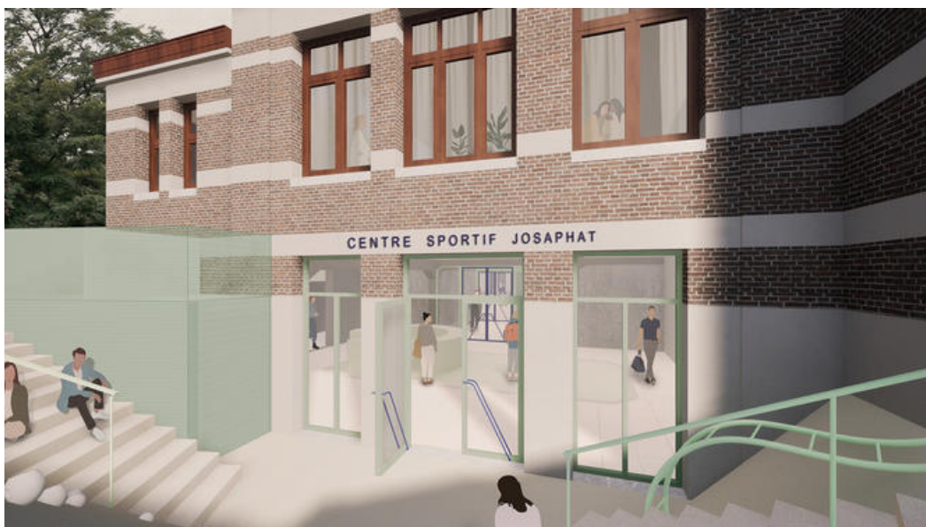
Jalon ludique guidant les visiteurs depuis le nouvel accès Louis Bertrand Â© Ledroit Pierret Polet Architectes