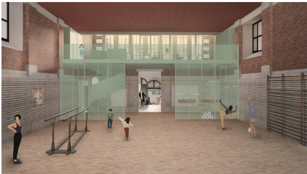
Nouvel ensemble de mezzanine/mobilier entre la salle de gymnastique et la salle d'armes Â© BINARIO ARCHITECTES - LEDROIT PIERRET POLET ARCHITECTES