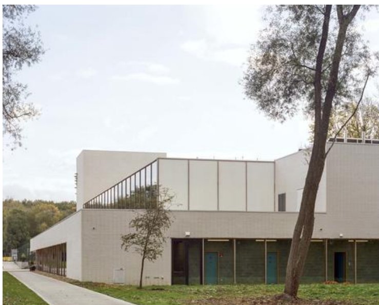
hall omnisports - façade ouest - vestiaires