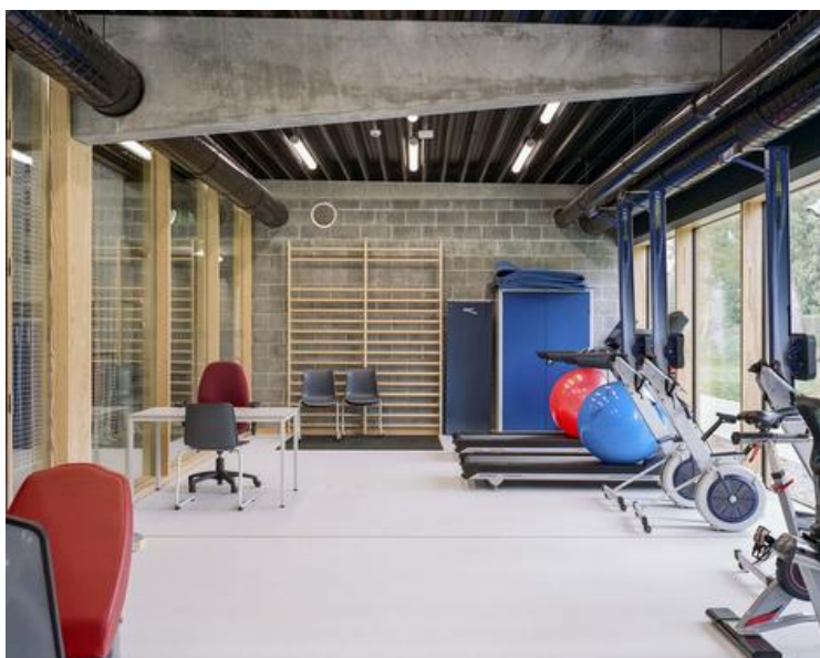
salle de conditionnement physique jouxtant la salle omnisports