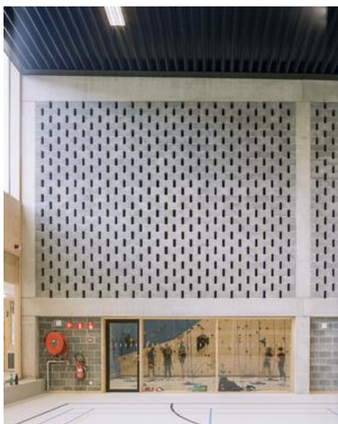
Vue vers la tour d'escalade depuis la salle omnisports