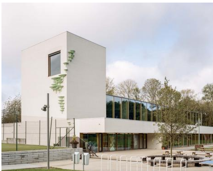
hall omnisports - angle nord est - entrée